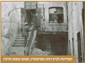
המדרגות לבית רבינו בפרעשבורג, תמונה משנת תרע"ג